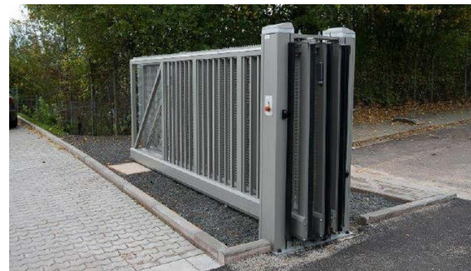
9 m Teleskopschiebetor, Rundstab Ø25, RAL 6005, Inline 250-T